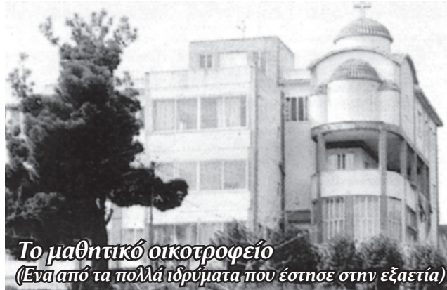
Το μαθητικό οικοτροφείο (Ένα από τα πολλά ιδρύματα που έστησε στην εξορία)