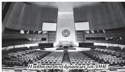
Η αίθουσα συνεδριάσεων του ΟΗΕ

Τον περασμένο Δεκέμβριο (2015) ήρθε στην Ελλάδα ο ειδικός εμπειρογνώμονας του Συμβουλίου Ανθρωπίνων Δικαιωμάτων του ΟΗΕ Χουάν Πάμπλο Μποχοσλάβσκι, ο οποίος είχε συναντήσεις με υπουργούς, κρατικούς παράγοντες, ανε-