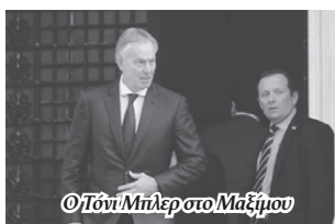
Ο Τόνι Μπλερ στο Μαξίμου

Ο Τόνι Μπλερ ήταν δέκα χρόνια (1997-2007) Πρωθυπουργός της Αγγλίας, αλλά δεν καταδέχθηκε να έρθει στην Ελλάδα ούτε μία φορά. Μας θυμήθηκε όμως τον περασμένο Νοέμβριο, όχι γιατί τώρα μας αγάπησε ούτε γιατί μας λυπήθηκε, με τα όσα τραβάμε, από τους φίλους του στην