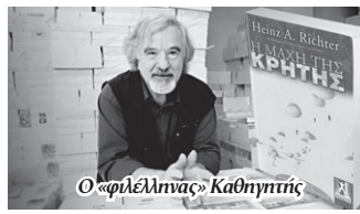
Ο «φιλέλληνας» Καθηγητής

Η Ακαδημαϊκή κοινότητα, που είναι πολύ "ευαίσθητη" για όλα τα προβλήματα που μαστίζουν τον τόπο, αντέδρασε άμεσα, με πρώτους τον Πρόεδρο της Ακαδημίας, τον αντιπρόεδρο, τον γ. γραμματέα και 16 ακόμα ακαδημαϊκούς δασκάλους, υπερασπίζοντας το Γερμανό καθηγητή με το σκεπτικό ότι έτσι ποινικοποιείται η ιστορική έρευνα . Έφθασαν μάλι-