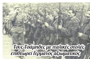
Τους Τσάμπδες με παλικές σπολιές επιθεωρεί Γερμανός αξιωματικός

τα «μαύρα σύννεφα» που συσσωρεύονται επάνω στα εθνικά μας θέματα, ώστε εγκαίρως να τα αντιμετωπίσουμε, εμείς περί πολλών άλλων τυρβαζόμε.