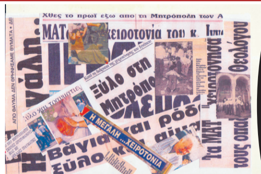
Μερικά από τα πρωτοσέλιδα εφημερίδων, της αιματοβαμμένης χειροτονίας του!

‘Ήταν μια καλή ιδέα του Ιγνατίου να το γιορτάσει διπλά φέτος. Το σωστό όμως θα ήταν να κουβαλήσει καμιά 20αρια δεσποτάδες για να γιορτάσουν ὅλοι μαζί για το ξύλο που ριξε στους χριστιανούς της Λάρισας