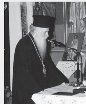
Ο π. Θεολόγος ομιλεί στους κατασκηνωτές στο Ι.Ν. Αγίου Κων/νου & Ελένης του σιλλόγλου «Σάπφειρος» Μεσαγγάλου

Από πληροφορίες που έχουμε, στις 27 Ιουλίου θα γίνει το μνημόσυνο του μακαριστού και αξέχαστου Σου Μητροπολίτη Λάρισας π. Θεολόγου, στην Ιερά Κομηνηνείο Μονή Στομίου Λάρισας, όπου επί δεκαοκτώ (18) χρόνια αναπαύεται το ιερό του σκήνωμα.