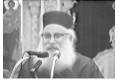
+ π. Αθ. Μυτιληναίος

ὁ Υἱός τοῦ Θεοῦ, δέν ἦρθε στόν κόσμο ναι καί ὄχι—θά πεί: ποιός εἶναι; τί κάνει; εἶναι ἔτσι; εἶναι ἔτσι;— ἀλλά ἦρθε ὡς ναι, καί οἱ ὑποσέσεις Του εἶναι «ναί» καί «ἀμήν». Δηλαδή: ὅλα θά πραγματοποιηθοῦν· ὁ Χριστός ὅ,τι εἶπε δέν ἀλλάζει τίποτε! Κοιτάξετε κατὰ πνεῦμα πῶς ταυριάζουν τά βιβλία! Κοιτάξετε! Ἐδῶ, ἀγαπητοί μου, ἕνας συγγραφέας, σέ διαφορετικό χρόνο—γιά νά μήν πῶ, κάποτε καί στό ἴδιο του τό βιβλίο— ἔχει ἀντιφάσεις· ὄχι διαφορετικοί συγγραφεῖς! Βλέπει λοιπόν κανεῖς τό ἐξῆς· ὅτι αὐτό σημαίνει ὁ Χριστός, πού εἶπε «ὁ οὐρανός καί ἡ γῆ παρελεύσονται, οἱ δέ λόγοι μου οὐ μή παρέλθωσι» 23 καί «ἰῶτα ἐν»... Τό «ἰῶτα» (ι), τό γίνωτ (ι), πού χρησιμοποιοῦμε στήν Ἄλγεβρα, εἶναι τό γιώτα τό ἑβραϊκό, αὐτό τό φοινικικό, τό σημιτικό. Ἀπό 'κεῖ εἶναι τό γίνωτ, πού λέμε στήν Ἄλγεβρα· ἀπό 'κεῖ εἶναι. Εἶναι τό πῶς μικρό γράμμα τοῦ ἑβραϊκοῦ ἀλφάβητου. Ὅταν λέει «ἰῶτα ἐν» δέν θά πέσει «ἡ μία κεραία»—εἶναι ὁ τόνος ἡ κεραία— δέν θά πέσει, σημαίνει ὅτι δέν θά πραγματοποιηθεῖ. «Οὔτε ἕνα γιώτα, οὔτε μία κεραία ἀπ' ὅ,τι σᾶς εἶπα δέν εἶναι δυνατόν νά μὴν πραγματοποιηθεῖ, δέν θά πέσει. Ὁ οὐρανός καί ἡ γῆ—αὐτό πού μοιάζει παράξενο καί μεγάλο— θά φύγουν ἀπό τή θέση τους· τά λόγια μου θά μένουν.» Συνεπῶς ὁ Χριστός εἶπε: «θά ξανάρθω!» Καί ἐδῶ εἶναι ἡ ἀξιοπιστία. «Πιστός ὁ λόγος», λέει ὁ ἀπόστολος Παῦλος, «καί πάσης ἀποδοχῆς ἄξιός» 24 . Εἶναι ἀξιοπιστος ὁ λόγος τοῦ Θεοῦ. Ὁ Χριστός λοιπόν θά ξανάρθει!