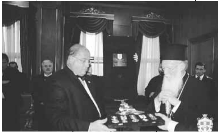
Τι κρίμα! ο Πατριάρχης να αποδέχεται τα «διάσημα» των Ναϊτών! Να τα θεωρεί άραγε ανώτερα από τα εγκόλπια και το σταυρό του Κυρίου;

Κατά την συνάντηση με τον κ. Κύριλλο, η οποία, κατά πληροφορίες, έγινε παρουσία του νομικού εκπροσώπου των «Ιπποτών» και οικονομικών παραγόντων, ο επικεφαλής των «Ιπποτών» αποκάλυψε τα φιλόδοξα σχέδιά του για τη Ρόδο.