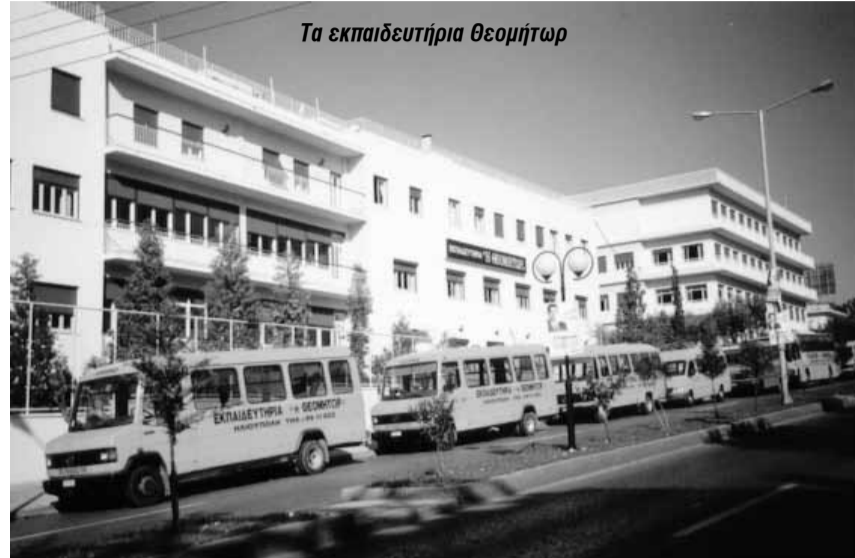
Τα εκπαιδευτήρια Θεομήτωρ

Διαβάζοντας κανείς για τη γενναία παροχή και τη συμπράσταση του αρχ. Ιερωνύμου Α στα εκπαιδευτήρια «θεομήτωρ» συγκινείται