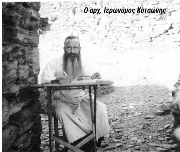
Ο αρχ. Ιερωνύμος Κοτσώνης

Όταν περάσουν οι καιροί και τα πάθη σβήσουν, τότε οι πικρίες εκείνων, που δεν άντεξαν την κρυστάλλινη διακονία του, θα έχουν διαγραφή και οι διάδοχοι γενιές θα καθηλώσουν το βλέμμα στην μορφή του. Θα τον νοιώσουν πατέρα. Θα σκύψουν σαν μαθητές στην προσφορά του και θα καυχηθούν «εν Κυρίω» ότι, στη δύση του εικοστού αιώνα, έλαμψε στο στερέωμα ένα μεγάλο αστέρι, που θα φωτίζει την εκκλησιαστική διαδρομή της τρίτης χιλιετίας.