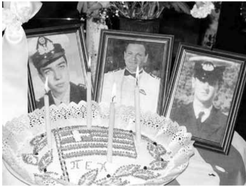
Οι τρεις ήρωες που περιμένουν δικαίωση

Να γιατί έστησαν οι Αμερικανοί την παγίδα με το επεισόδιο στις βραχονησίδες των Ιμίων βάζοντας τους Τούρκους να διεκδικούν «γκρίζες ζώνες» και να απαιτούν επανεξέταση των συνθηκών που ρυθμίζουν το καθεστώς του Αιγαίου. Και επειδή κανένας πόλεμος δεν γίνεται για τα μάτια της «ωραίας Ελένης» αλλά για εφήμερα οικονομικά συμφέροντα όπως εδώ στα Ιμια ( όσμιο, κόκκινος υδράργυρος, χρυσός ), γι' αυτό και θα συνεχίσουν οι άνθρωποι να αναζητούν «ΚΡΥΜΜΕΝΑ ΜΥΣΤΙΚΑ» αλληλοσπαραζόμενοι, μέχρι να έλθουν εις εαυτόν και πουν, σαν τον άσωτο του Ευαγγελίου: «αναστάς πορεύσομαι προς τον πατέρα μου...» (Λουκά 15, 18).