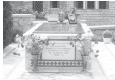
ο τάφος του π. Αθ. Μυτιληναίου

Θα πάρωμε το παράδειγμα του Ιωάννου του Ευαγγελιστού, μέσα από το βιβλίο της Αποκαλύψεως, κεφάλαιον 5, 2-5, που λέγει τα εξής: «Άκουσα έναν Άγγελον με ισχυρή φωνή, που έλεγε: Ποιος είναι άξιος να ανοίξη αυτό το βιβλίο; Κι εγώ άρχισα να κλαίω, λέγει ο Ιωάννης, επειδή δεν θα μπορούσε κανείς να μάθη το περιεχόμενον του βιβλίου».