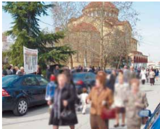
Αντί άλλου σχολιασμού από την μεγάλη συγκέντρωση - διαμαρτυρία - της 25ης Μαρτίου 2012 διαβάστε δίπλα ένα από τα πολλά σχόλια που έγραψαν...