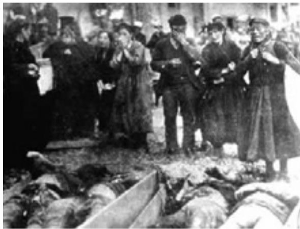
Θύματα της σφαγής

α) Σε αναφορά του προς το Φόρειν Όφισ ο Άγγλος πρέσβης στη Βέρνη σερ Χόρας Ράμπολτ λέγει: «Κάθε μέρα οι Έλληνες της Κωνσταντινούπολης και των περιχώρων της εκκαθαρίζονται και αποστέλλονται στο εσωτερικό της χώρας. Οι περιουσίες τους κατάσχονται και τα υπάρχοντά τους βγαίνουν στον πλειστηριασμό. Οι γυναίκες και τα κορίτσια διανέμονται μεταξύ των Γερμανών και των επιφανών μουσουλμάνων. Όλα τα χωριά γύρω από τη Σμύρνη, Καρασό κ.λ.π. λαφυραγωγούνται και δι-