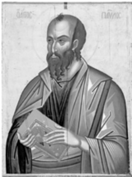
Ο Απόστολος Παύλος

και της δικαιοσύνης, που εξετάζει η προς Ρωμαίους Επιστολή, έχουν χαρακτηριστικές αντιθέσεις: « Οι τα όρη κατειληφότες μοναχοί, και μυρίαν άσκησιν επιδειξάμενοι, αστεφάνωτοι απελεύσονται; Ει γαρ οι πονηροί μη κολάζονται, μηδέ έστι μηδενός αντίδοσις, ερεί τις έτερος ίσως, ότι ουδέ οι αγαθοί στεφανούνται. Ναι, φησί τούτο γαρ Θεώ πρέπον, βασιλείαν είναι μόνον και μη γέενναν. Ουκούν ο πόρνος και ο μοικός και ο μυρία κακά εργασάμενος, των αυτών απολαύσεται τω σωφροσύνην και αγιουσύνην επιδειξάμενω, και Παύλος μετά Νέρωνος στήσεται. μάλλον δε και ο διάβολος μετά Παύλου » (Ε.Π.Ε. 17, 574). Μετάφρασις: Τόσοι μοναχοί, που κατέλαβαν τα όρη και έδειξαν πολύ μεγάλη άσκησι, θα φύγουν, λοιπόν, αστεφάνωτοι απ' αυτό τον κόσμο; Αν, λοιπόν, δεν τιμωρούνται οι κακοί, ούτε ανταπόδοσις υπάρχει για κανέναν, θα ηπ ίσως κάποιος, ότι ούτε οι αγαθοί βραβεύονται. Ναι, λένε μερικοί, μόνο βασιλεία αρμόζει στο Θεό, όχι να υπάρχει και γέεννα! Ε, τότε, ο πόρ-