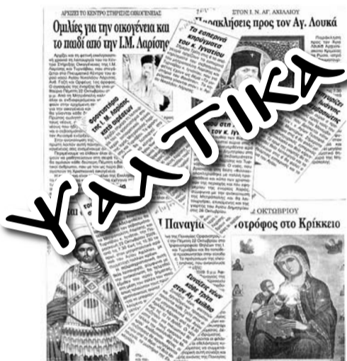
Δημοσιεύματα μιας ημέρας

Καθημερινά, σχεδόν, βλέπουμε να διαφημίζονται στον τοπικό τύπο πάνω από δέκα διαφορετικές εκδηλώσεις της Μητρόπολης, με αποτέλεσμα, κάποιος που θα διαβάσει την εφημερίδα να θαυμάζει τις δραστηριότητες αυτές.