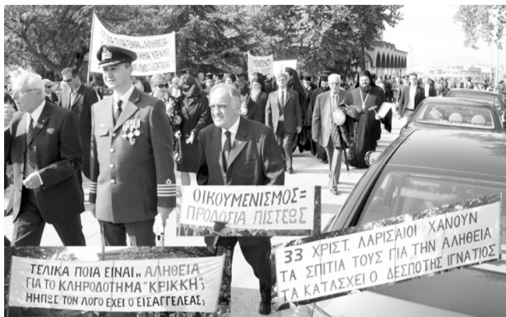
Αυτά γράφανε τα τρία αναρτημένα πανώ

κοινωνία, ευυπόληπτων πολιτών. Με βάση το παραπάνω γενικό πνεύμα και τις πρόσφατες επίκαιρες εξελίξεις στο θέμα της προδοσίας της Πίστεως και τα «ανοίγματα» προς τον Πάπα, όπως συνέβη με τα θλιβερά γεγονότα στο κατάπτυστο συμβούλιο των «Εκκλησιών» στην Κύπρο, προσπαθήσαμε να δώσουμε ένα τέτοιο μήνυμα κατά τη διαμαρτυρία μας. Τα πανώ, λοιπόν, είχαν αντιοικουμενιστικό, κυρίως, περιεχόμενο , αλλά και σχετικό με την καθαροση στην Εκκλησία, χωρίς φυσικά να θίγουμε προσωπικά κανένα. Κι αυτό, κυρίως, από σεβασμό προς τις δικαστικές αποφάσεις, τις οποίες βέβαια, δεν πρόκειται να αφήσουμε αναπάντητες, εφόσον δεν εξαντλήσουμε κάθε νόμιμο δικαίωμά μας, προσφεύγοντας τόσο στα Ανώτατα