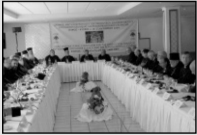
Η 11η συνάντηση Ορθοδόξων - Παπικών στην Κύπρο

αλλά ΤΗΝ ΕΚΚΛΗΣΙΑ ΤΟΥ . Πληθυντικός αριθμός αποδίδεται μόνον στις ομόδοξες τοπικές Εκκλησίες του Χριστού, οι οποίες, όμως, αποτελούν την ΜΙΑ, ΑΓΙΑ, ΚΑΘΟΛΙΚΗ ΚΑΙ ΑΠΟΣΤΟΛΙΚΗ ΕΚΚΛΗΣΙΑ . Η κάθε τοπική Εκκλησία του Χριστού δεν είναι κομμάτι της ΟΡΘΟΔΟΞΗΣ ΕΚΚΛΗΣΙΑΣ, αλλά ΟΛΗ η Ορθόδοξη Εκκλησία του Ιησού Χριστού. « Έν τη Μία αι πολλοί, και εν ταις πολλαίς η Μία ». Ο διάλογος ανήκει στην ουσία της Ορθόδοξης Εκκλησίας, και έχει ως βάση της την αλήθεια, γι' αυτό πάντα ο διάλογός της είναι λόγος αληθείας, και