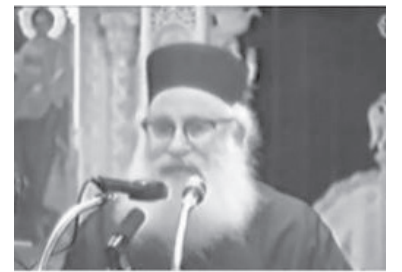
+ π. Αθ. Μυτιληναίος

ὅπως Νικητὴς ὑπῆρξε καὶ ὁ ἴδιος καὶ ὄχι νικημένος. Ὁ νικητὴς εἶναι ἕνας ἄνθρωπος δυναμικός· ὄχι παθητικός καὶ στατικός, ὅπως κατηγοροῦν συνήθως οἱ ἀπ' ἔξω τοὺς ἀληθεῖς Χριστιανούς.