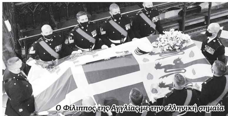
Ο Φίλιππος της Αγγλίας με την ελληνική σημαία

ερημώθηκε. Και η Εκκλησία μας πώς αντιδρά; Πού έχει κρυφτεί; Παραμένει άνευρη, αφημένη, αμήχανη στην παραζάλη του αδιάστατου πολιτικού κατεστημένου; Παραμένει ανήμπορη να πει ΟΧΙ στον υποκριτή Καίσαρα. Παραμένει σιωπηλή και υποταγμένη στις απαιτήσεις ορέξεις