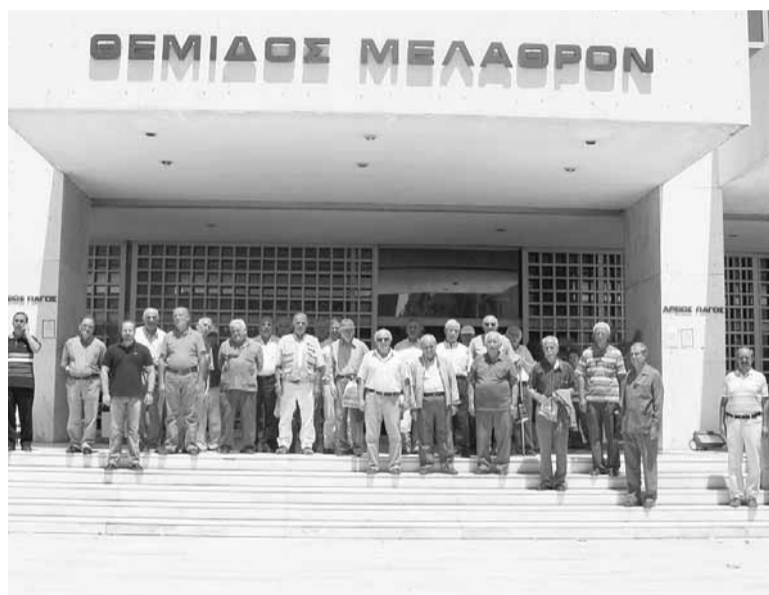
Οι διωκόμενοι από τον δεσπότη Ιγνάτιο Λάππα Λαρισιαίοι χριστιανοί, εξέρχονται από τον Άρειο Πάγο