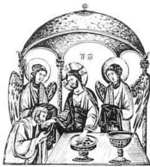
ΕΙΣ ΤΗΝ ΑΙΓΥΠΤΙΑΝ

Όσοι αμφιβάλλουν γι’ αυτή την βεβαιότητα, της Μεταλήψεως και Κοινωνίας αυτού τούτου του Σώματος και του Αίματος του Χριστού, δεν είναι πιστοί της Εκκλησίας του Χριστού, διό και « τούτους απόβλητους γίνεσθαι της Εκκλησίας » [Καν. 2 ος Συν. Αντιοχείας, Σύνταγμα Θείων και Ιερών Κανόνων, Γ. Ραλλή - Μ. Ποτλή, σελ. 125-129]. Αλλά και όσοι ρασοφόροι Κληρικοί της Εκκλησίας του Χριστού αποδέχονται και συμμετάσχουν σε « βέβηλους και γράωδεις μύθους » [Α’ Τιμ. 4,6-7], και συζητήσεις που αμφισβητούν την Αγιότητα και την παντοδυναμία του Μυστηρίου της Θείας Ευχαριστίας, Μεταλήψεως και Κοινωνίας του Σώματος και του Αίματος του Θεανθρώπου Ιησού Χριστού, και μάλιστα αποτολμούν, οι άθλιοι, με ανούσιους δικολαβισμούς και παραθεολογίες να αποδείξουν, ότι υπάρχουν δήθεν προφυλάξεις από την Εκκλησία, και ότι δεν υπάρχει κίνδυνος μετάδοσης ασθενειών, προσφέρουν αρνητικότερον έργο στην Εκκλησία του Χριστού, προσέτι δε είναι επιλήθμονες και ανάξι της αποστολής τους, και είναι περιττόν να τονιστεί, ότι με την όλως απαράδεκτη και αντί/Γραφική τους αυτή συμπεριφορά και πράξη αποδεικνύουν και την δικιά τους ενυπάρχουσα και υποβόσκουσα αμφιβολία, ότι ελλοχεύει πράγματι κίνδυνος στα « Άγια των αγίων! » κατά την μετάληψη της Θείας Κοινωνίας. Αιδώς! Άπαγε της βλασφημίας!