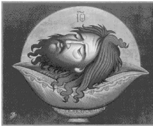
- ΔΙΑ ΤΟΝ ΕΛΕΓΧΟΝ ΤΩΝ ΠΑΡΑΝΟΜΟΥΝΤΩΝ