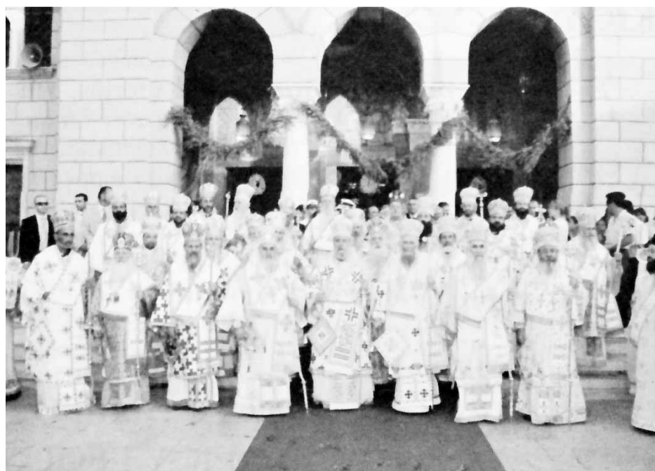
Όχι, δεν κρύφτηκαν ακόμα για να μετανοήσουν, απλώς ποζάρουν στην... «πασαρέλα» (!!)